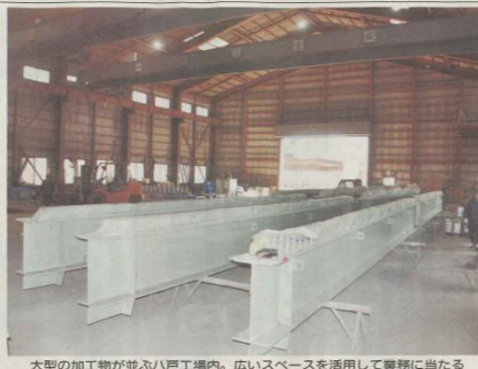
大型の加工物が並ぶ八戸工場内。広いスペースを活用して業務に当たる

竹塚は、店舗に可能なセルフレジを導入する。セルフレジは、商品の仕分け作業を自動化し、従業員の負担を軽減する。また、商品の仕分け作業を自動化することで、商品の仕分け作業の効率を向上させる。このシステムは、商品の仕分け作業を自動化し、従業員の負担を軽減する。また、商品の仕分け作業を自動化することで、商品の仕分け作業の効率を向上させる。