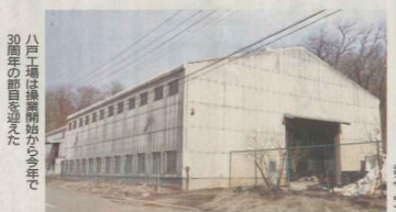
八戸工場は産地が中心で、30周年の節目を迎えた