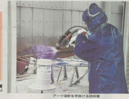
アーフ溶射を手掛ける技術者

竹塚は、店舗に可能なセルフレジを導入する。セルフレジは、商品の仕分け作業を自動化し、従業員の負担を軽減する。また、商品の仕分け作業を自動化することで、商品の仕分け作業の効率を向上させる。このシステムは、商品の仕分け作業を自動化し、従業員の負担を軽減する。また、商品の仕分け作業を自動化することで、商品の仕分け作業の効率を向上させる。